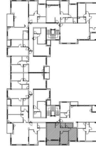
Stan br. 34 - LAMELA 2